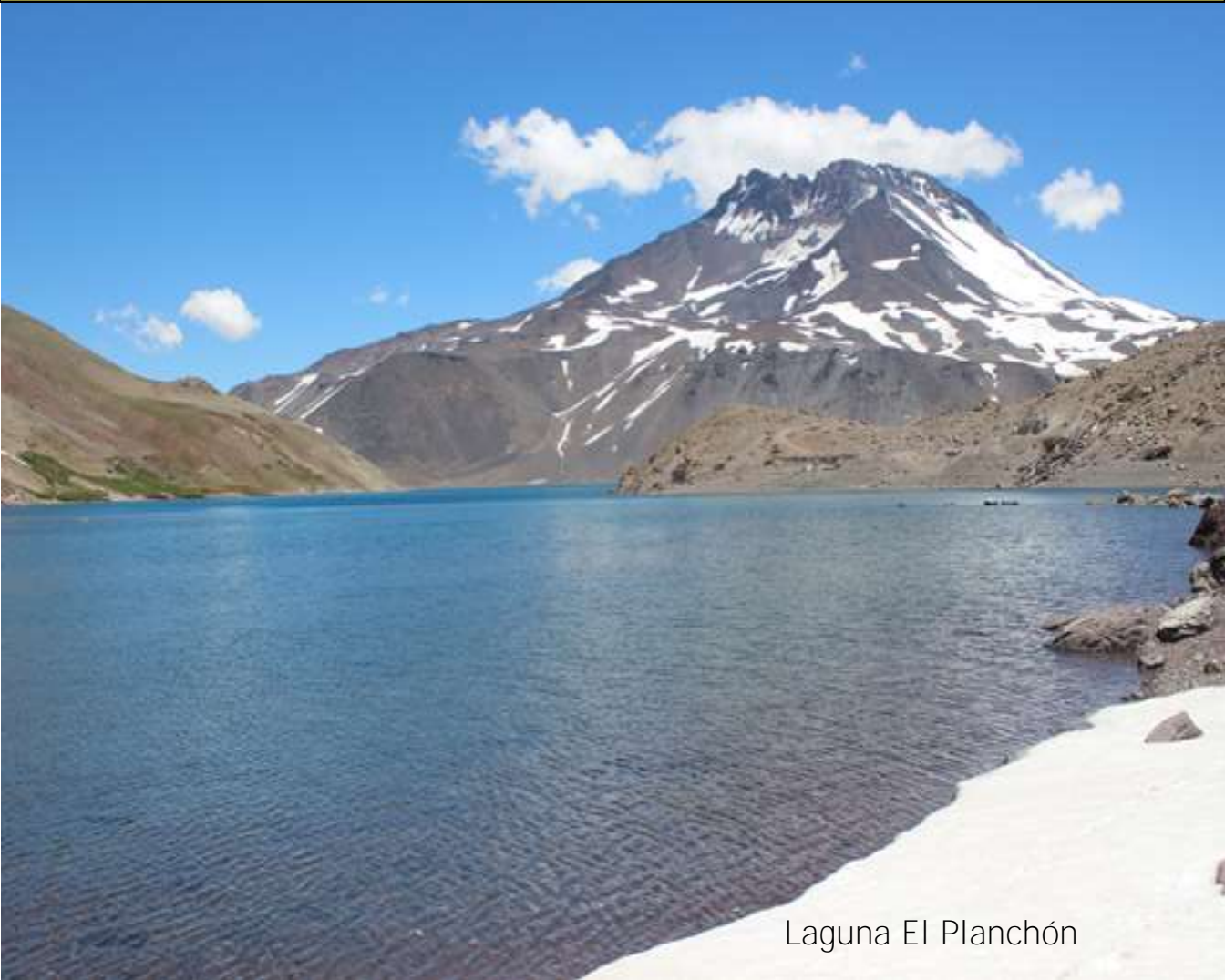
Laguna El Planchón